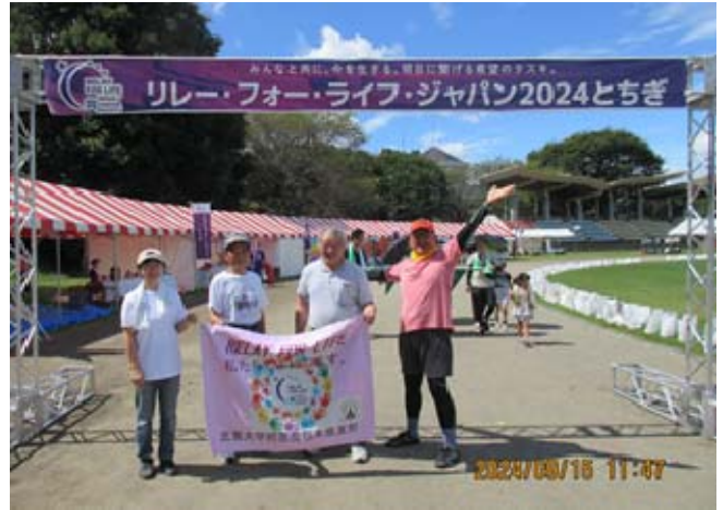
(2日目のリレーウォーク)