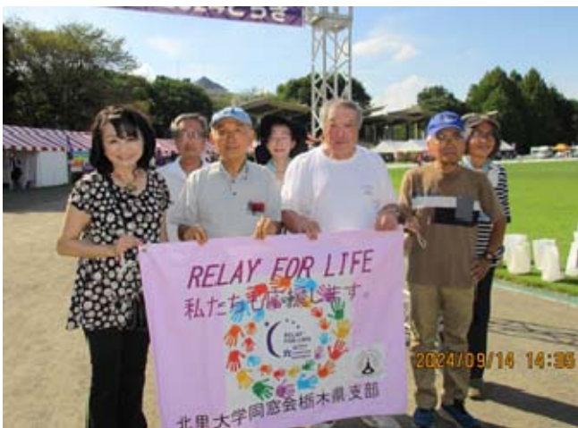
(開会式後のリレーウォーク)

去る9月14～15日、第12回のRelay for Life JAPAN 2024 in TOCHIGI が壬生町の総合公園陸上競技場で開催されました。栃木県支部では北里大学は生命科学の総合大学として、第一回から参加しており、この第12回にも参加しました。近年、新型コロナウイルス感染症拡大を防止する為もあり、Relay for Lifeの参加者が減少しています。今回、支部としての参加でも、従来の徹夜しての24時間リレーウォークには参加せず、日中のみのリレーウォークとしました。