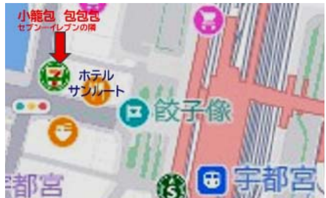
(小籠包 包包包は宇都宮駅より石口より直ぐ)